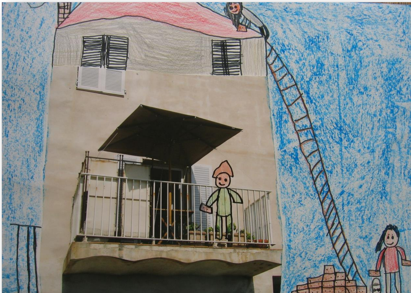
Jan Novak, 3. c (3. mesto na 3. šolskem literarno-likovnem natečaju: »Reševanje konfliktov«; 1. triada)