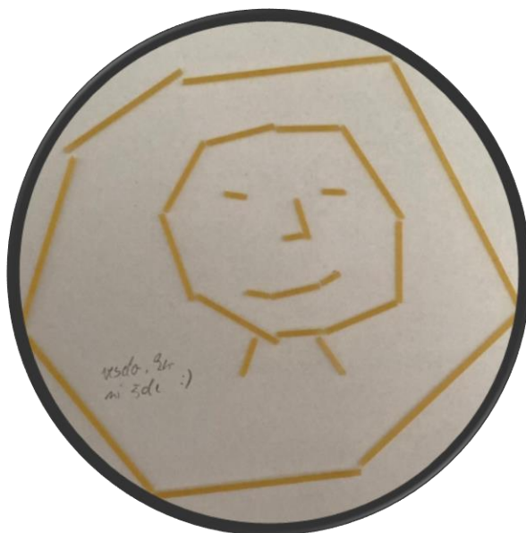
Luka Behek, LS2, Gibanje črte in točke