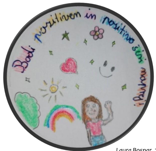
Laura Bosnar, 7. c

Taja Berkopec, 5. a (1. mesto na 3. šolskem literarno-likovnem natečaju: »Reševanje konfliktov«; 2. triada)