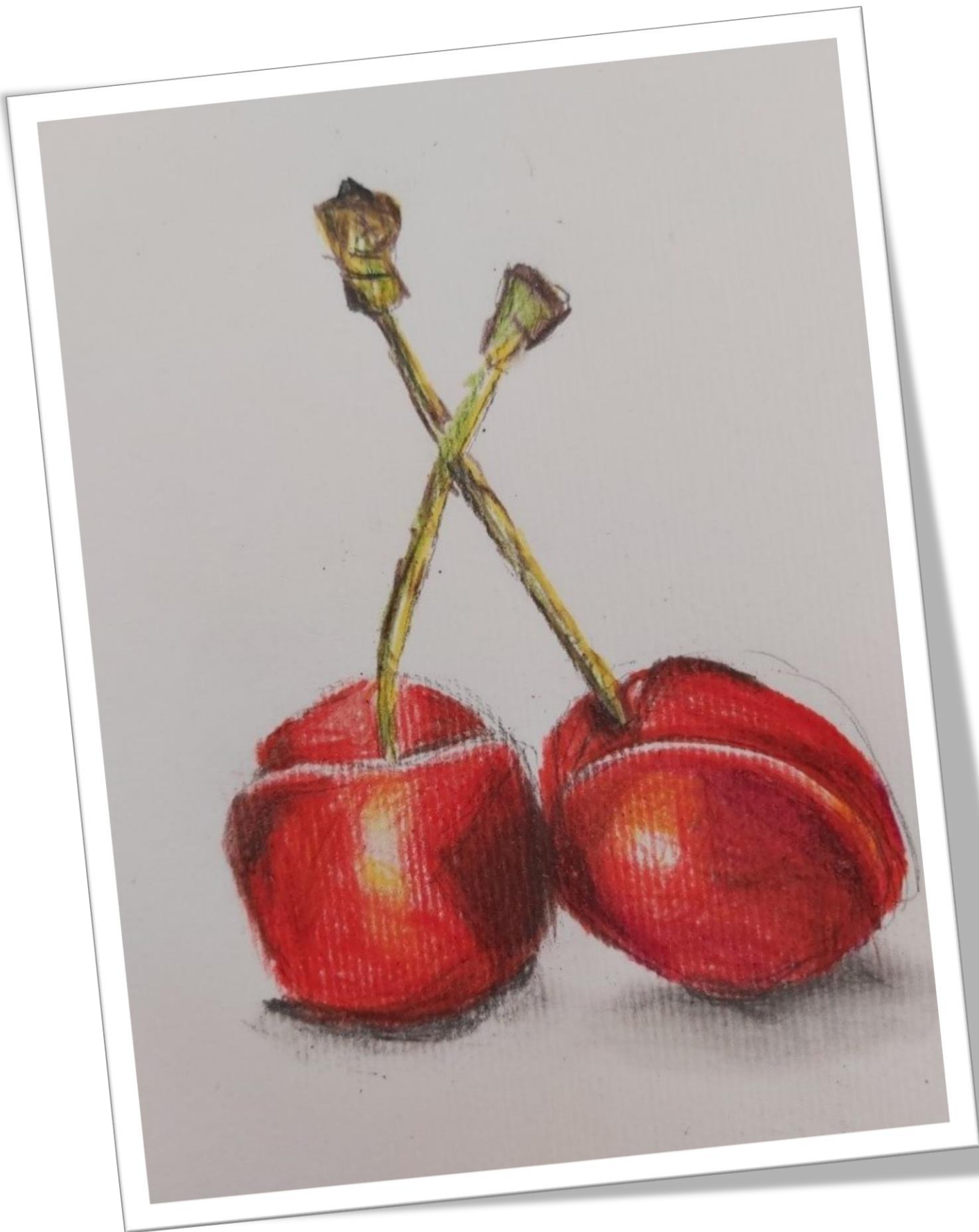
Brina Potočnik, 6. c, Češnje