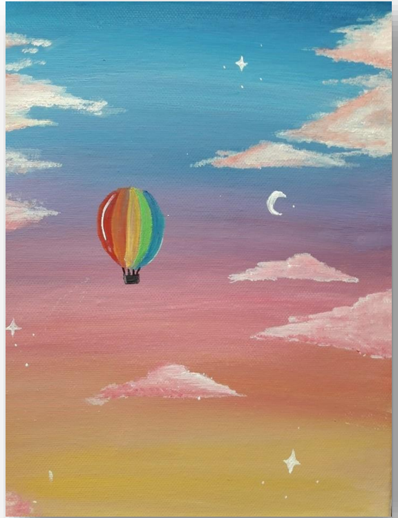
Lucija Žuvela, 9. b, Barvna in zračna perspektiva

(priznanje na literarnem natečaju Župančičeva frulica)