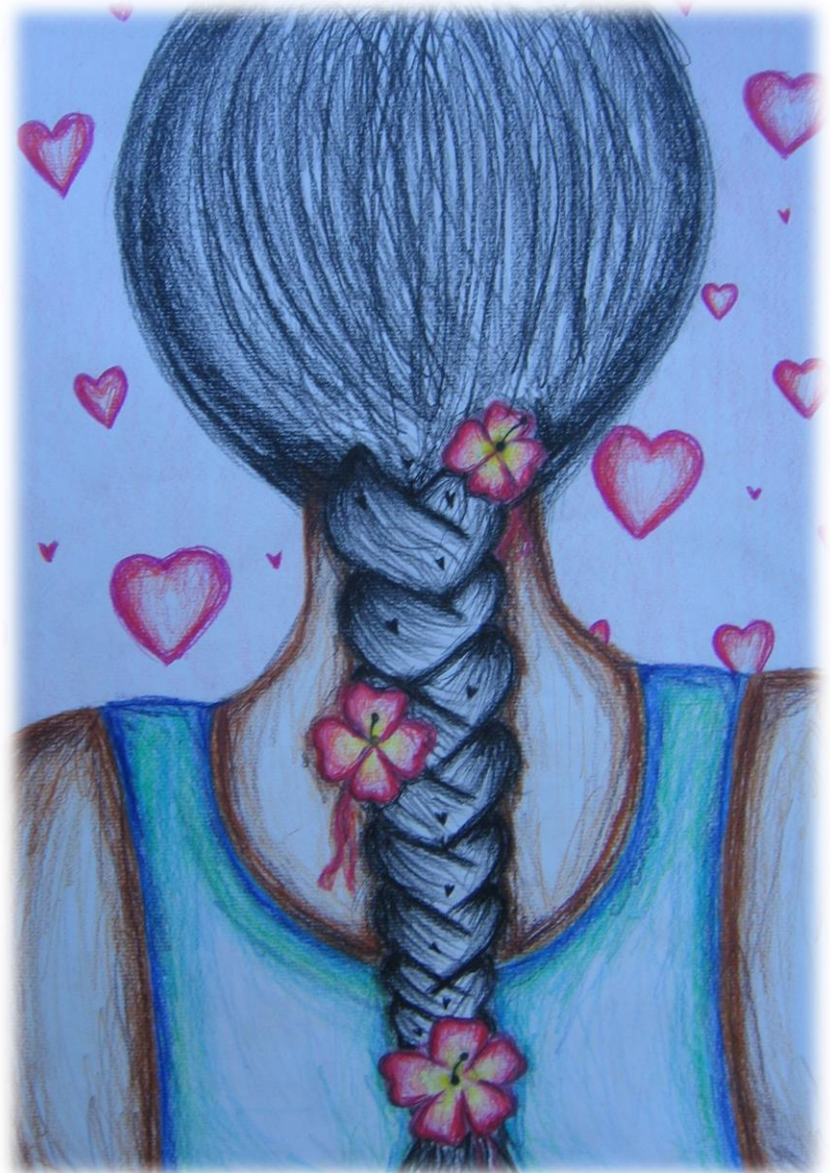
Naja Bauman, 6. c, Ko si zaljubljen, si lep