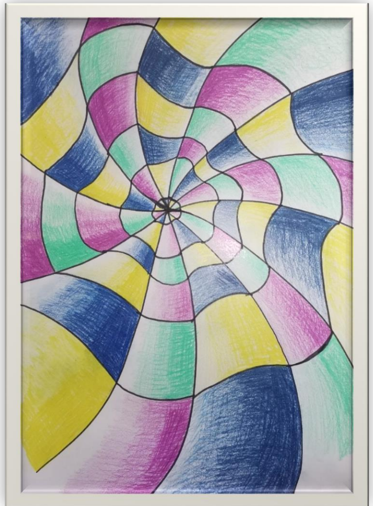
Eva Kočar, LS3, Zaporedni kontrast