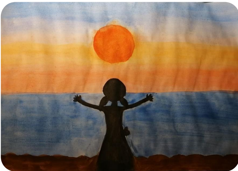
Natalija Likar, 8. a

( uvrstitev med objavljena dela na 3. šolskem literarno-likovnem natečaju: »Reševanje konfliktov«; 2. triada )