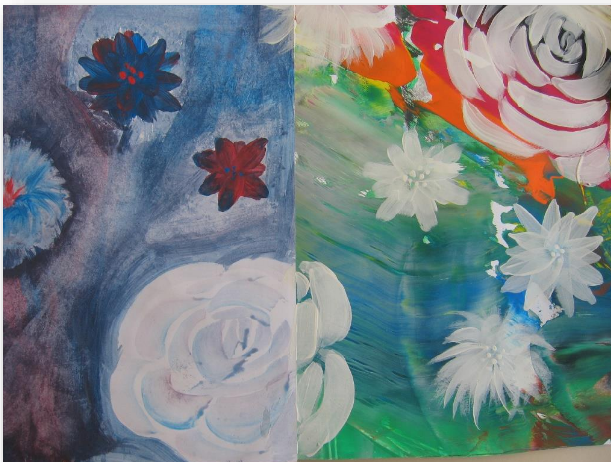
Tjaša Hafner Korošec, 8. a, Ohranimo cvetje tudi za zanamce