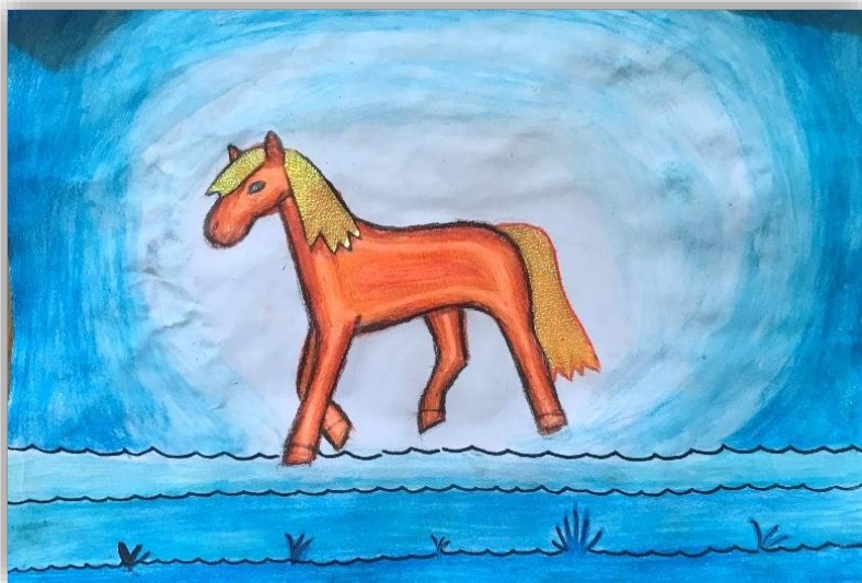
Maksim Groznik, 8. a, Količinsko barvno nasprotje 2

in naučil se, da osel gre samo enkrat na led.