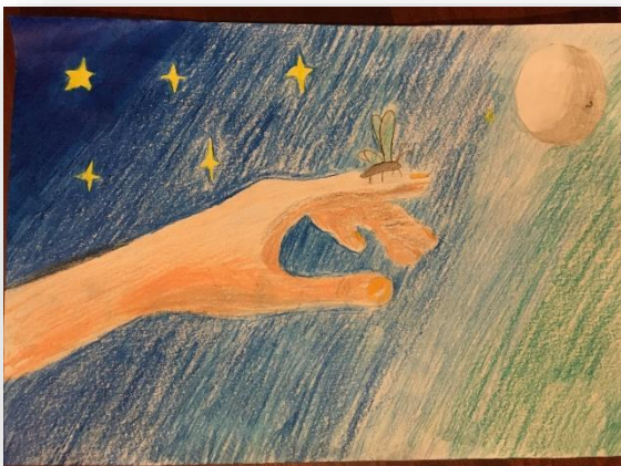
Klara Greblo, LS 1, Valeur