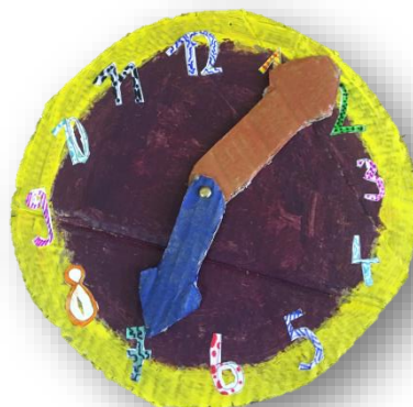
Hana Popovič, 3. a