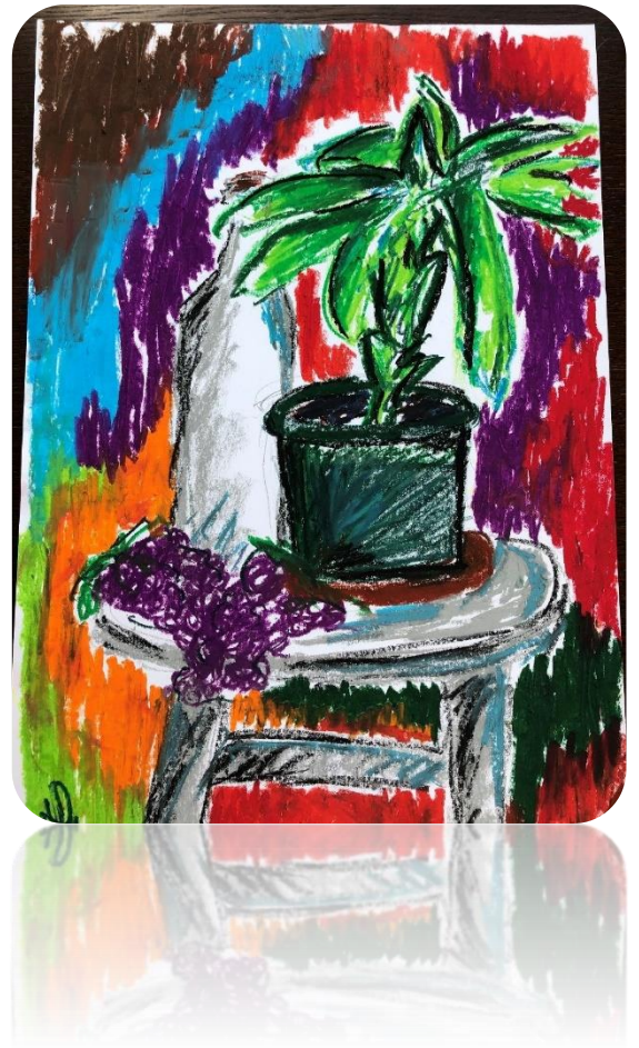
Ula Odlazek Mesar, LS2, Glasba in likovnost