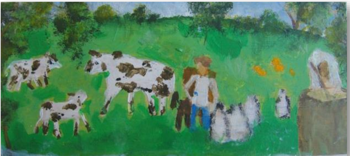
Brina Potočnik, 6. c

Tjaša Hafner Korošec, 8. a ( uvrstitev med objavljena dela na 3. šolskem literarno-likovnem natečaju: »Reševanje konfliktov« )